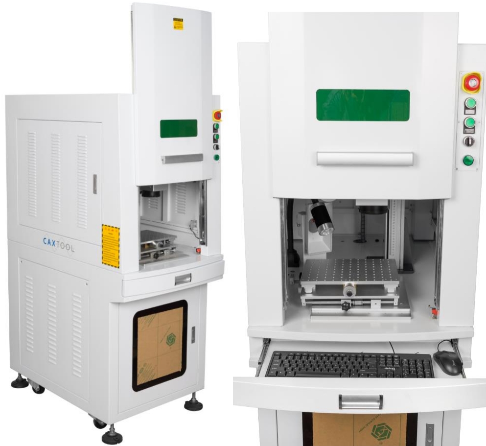
Kép: Fiber lézer jelölő galvo fej (tükrök) / Fiber laser marking galvo head

Adószám: 12871856-2-06 Adószám: HU 12871856 Bankszámla száma: 57600101-11102986 SWIFT (BIC): TAKBHUHB IBAN: HU65 57600101 11102986 00000000 cégjegyzékszám: 06-09-014002 info: